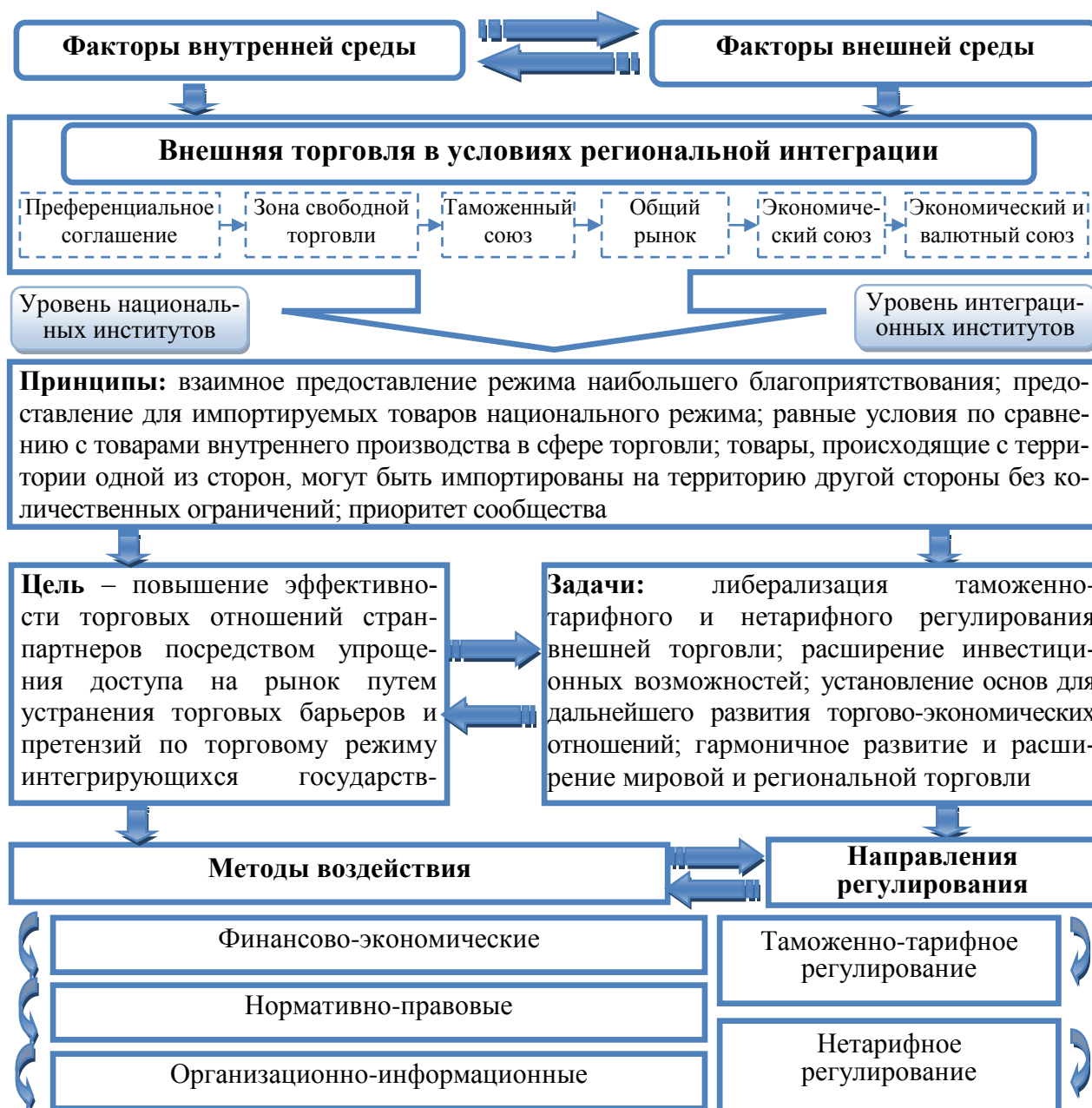
Рисунок 1 – Концептуальная модель механизма сбалансированного развития внешней торговли в условиях региональной интеграции

Примечание – Рисунок составлен автором по результатам собственных исследований.