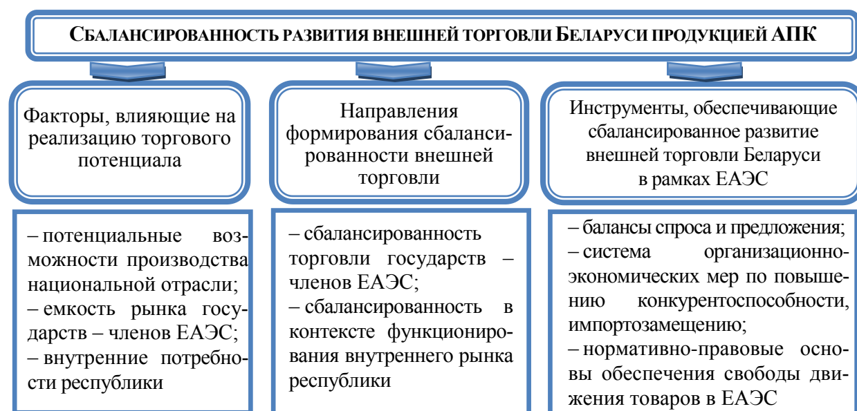
Рисунок 4 – Концептуальная модель обеспечения сбалансированного развития внешней торговли Беларуси продукцией АПК в контексте интеграционных процессов

Примечание – Таблица рассчитана автором по результатам собственных исследований на основе данных Национального статистического комитета Республики Беларусь.