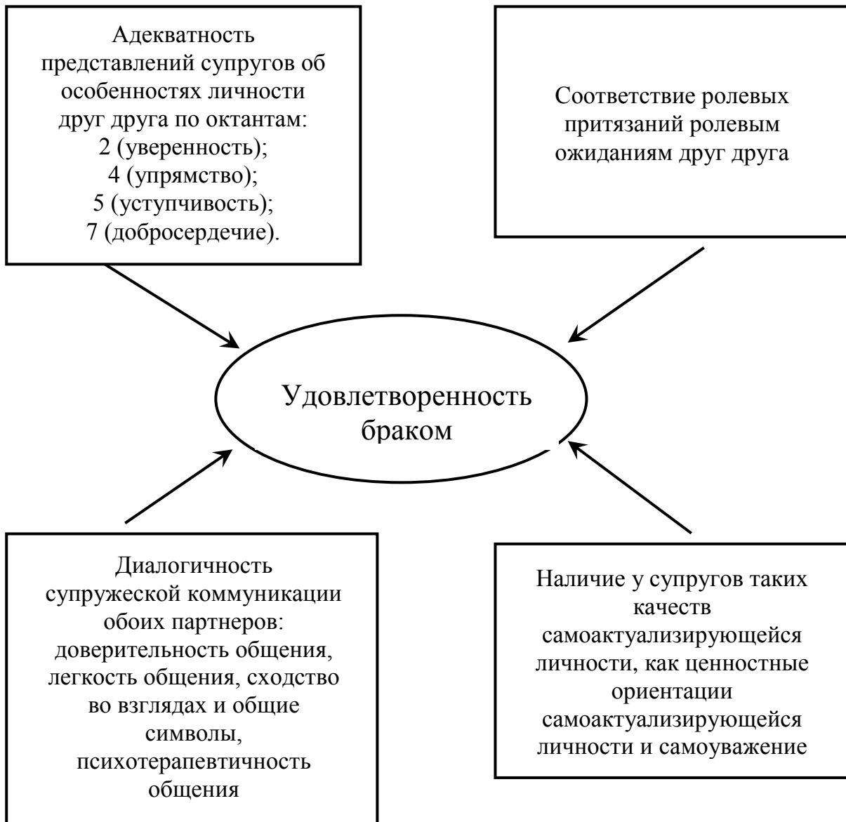
Рисунок 3. – Межличностные экспектационные условия удовлетворенности браком

Наиболее тесные положительные корреляции обнаружены между удовлетворенностью браком и умением строить супружескую коммуникацию в виде диалогического взаимодействия. Связи на уровне p \leq 0,001 выявлены по всем замерявшимся параметрам: доверительность общения, его легкость и психотерапевтичность, а также взаимопонимание между супругами, сходство взглядов и общие символы. Такие корреляции имеют место как по отношению к собственной удовлетворенности браком, так и по отношению к удовлетворенности браком супруга.