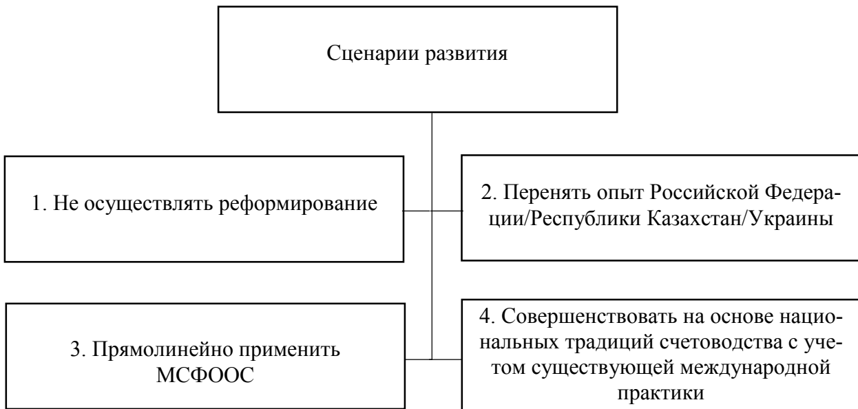
Рисунок 1. — Возможные сценарии развития существующей системы финансового учета и отчетности в Вооруженных Силах

с национальной обороной. Кроме того, ни одна из стран мира прямолинейно не внедряет МСФООС, а адаптирует данную систему в соответствии со своими национальными особенностями.