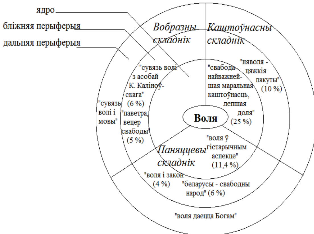
Рысунак 5. Структура канцэпту воля

Дыяхранічны аспект даследавання канцэптаў рэпрэзентаваў эвалюцыю лінгваментальных адзінак у моўнай свядомасці беларускіх пісьменнікаў як яркіх прадстаўнікоў беларускага народа. У хрэстаматыйных творах засведчаны важныя падзеі айчыннай гісторыі, адлюстраваны шлях беларусаў да незалежнасці, гісторыя развіцця беларускай мовы.