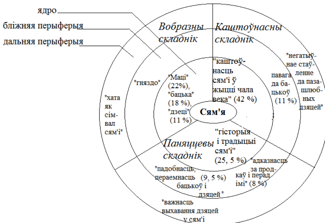
Рысунк 2. Структура канцэпту сям'я

Аналіз моўнага матэрыялу, які аб'ектывуе канцэпт сям'я , дазваляе зрабіць экстралінгвістычныя вывады пра інстытут сям'і ў беларускім грамадстве, прасачыць яго эвалюцыю.