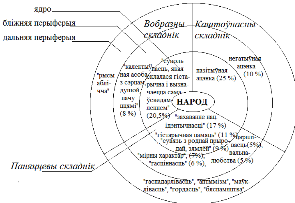
Рысунак 3. Структура канцэпту народ

лексем канцэпту. Выяўлены і пацверджаны кантэкстамі з мастацкіх твораў такія паняццевыя кампаненты, як ‘абуджэнне самасвядомасці беларусаў’, ‘гістарычная памяць беларусаў’, ‘сувязь народа і Радзімы’ і інш.