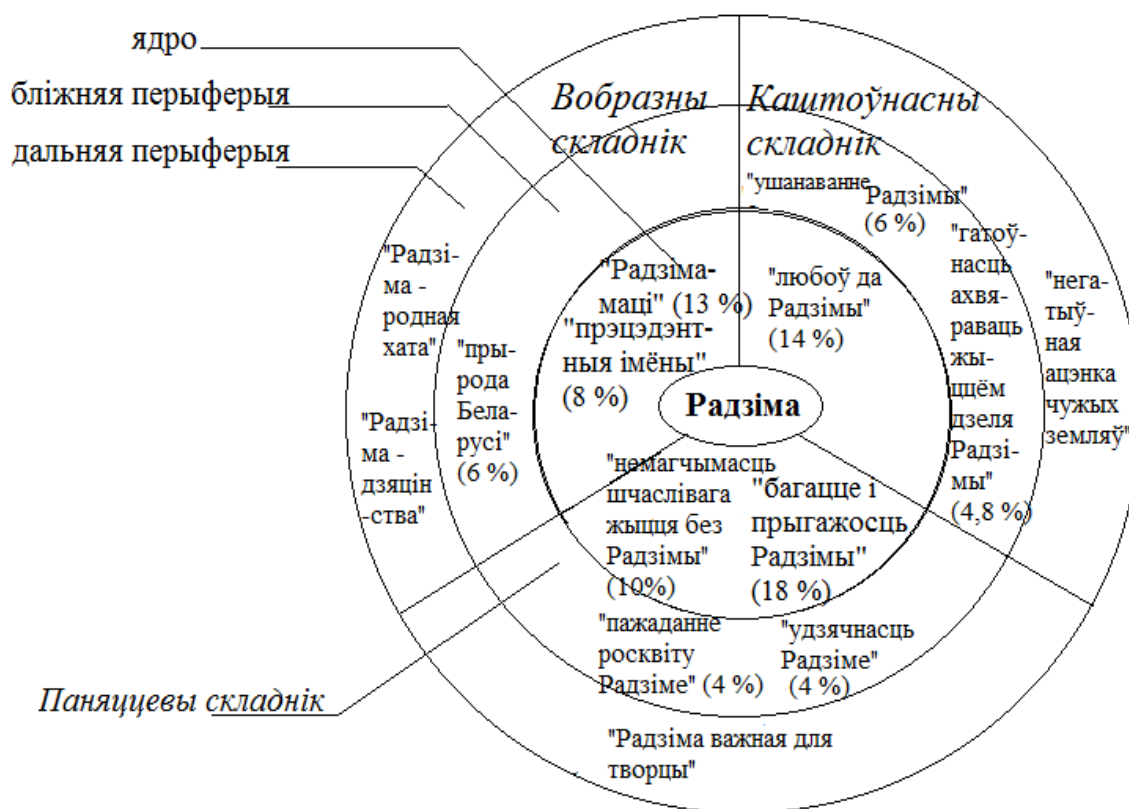
Рысунак 1. Структура канцэпту Радзіма

Колькасны аналіз лексем-вербалізатараў і паняццевых кампанентаў дазваляе змадэляваць структуру канцэпту, якая ўключае ядро, бліжняю і дальнюю перыферыі: