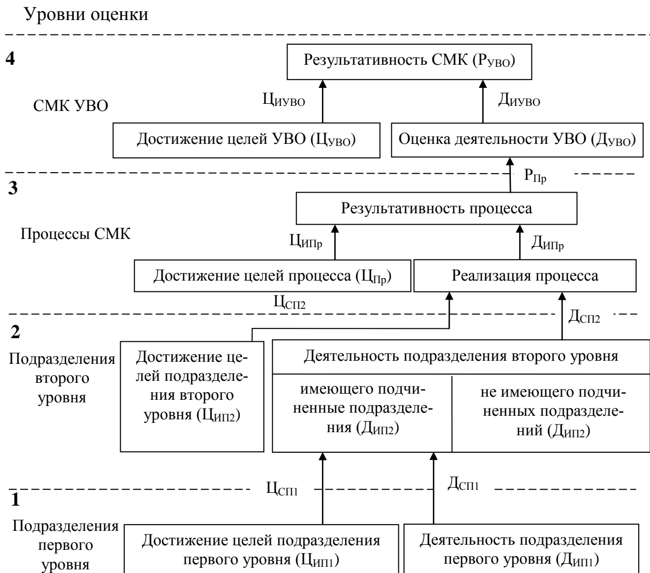
Рисунок 2. — Схема оценки результативности СМК УВО

Для оценки деятельности подразделений второго уровня, не имеющих подчиненных подразделений, и первого уровня используется метод квалиметрии, основанный на экспертной балльной оценке.