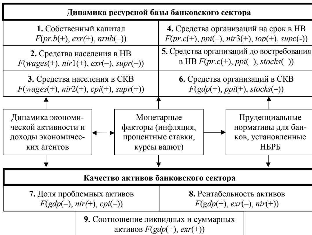
Рисунок 2. — Структура модели трансформации макроэкономических шоков в банковские риски 2

Автором диссертационного исследования также предложена модель трансформации макроэкономических шоков в банковские риски, состоящая из девяти эконометрических уравнений (рисунок 2).