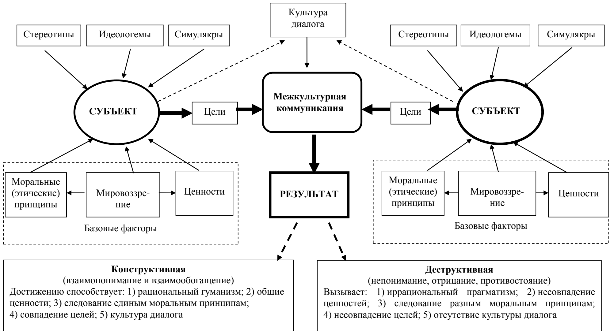
Рисунок 2. – Модель межкультурной коммуникации